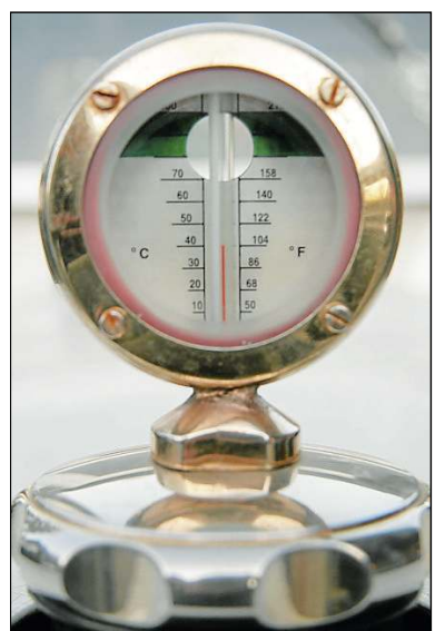
Das Thermometer für die Kühler-temperatur befindet sich außen auf der Motorhaube.