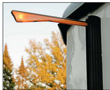
Links geht's lang: Ein historischer Winker.