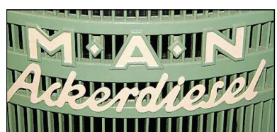
Frisch gestrichen: Die Maschinen sind liebevoll gepflegt.

Von unserem Redaktionsmitglied MIRCO BORGSMANN